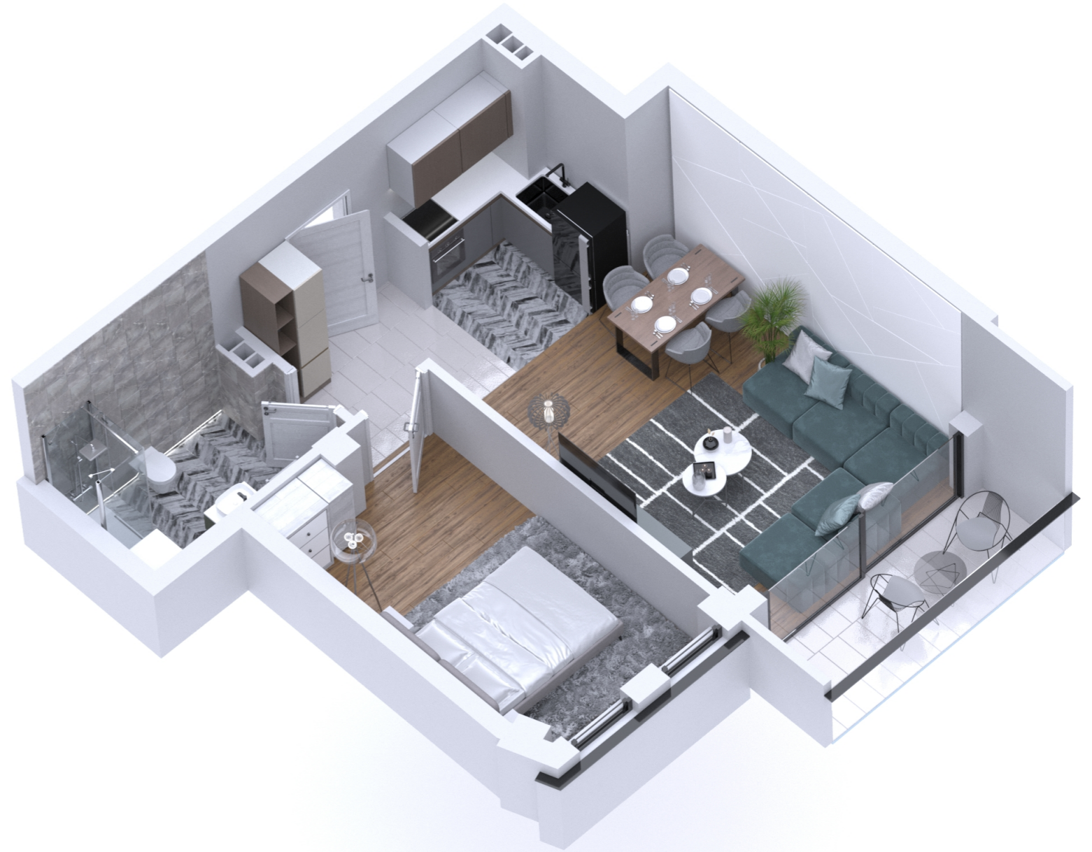
POLOŽAJ U OBJEKTU: