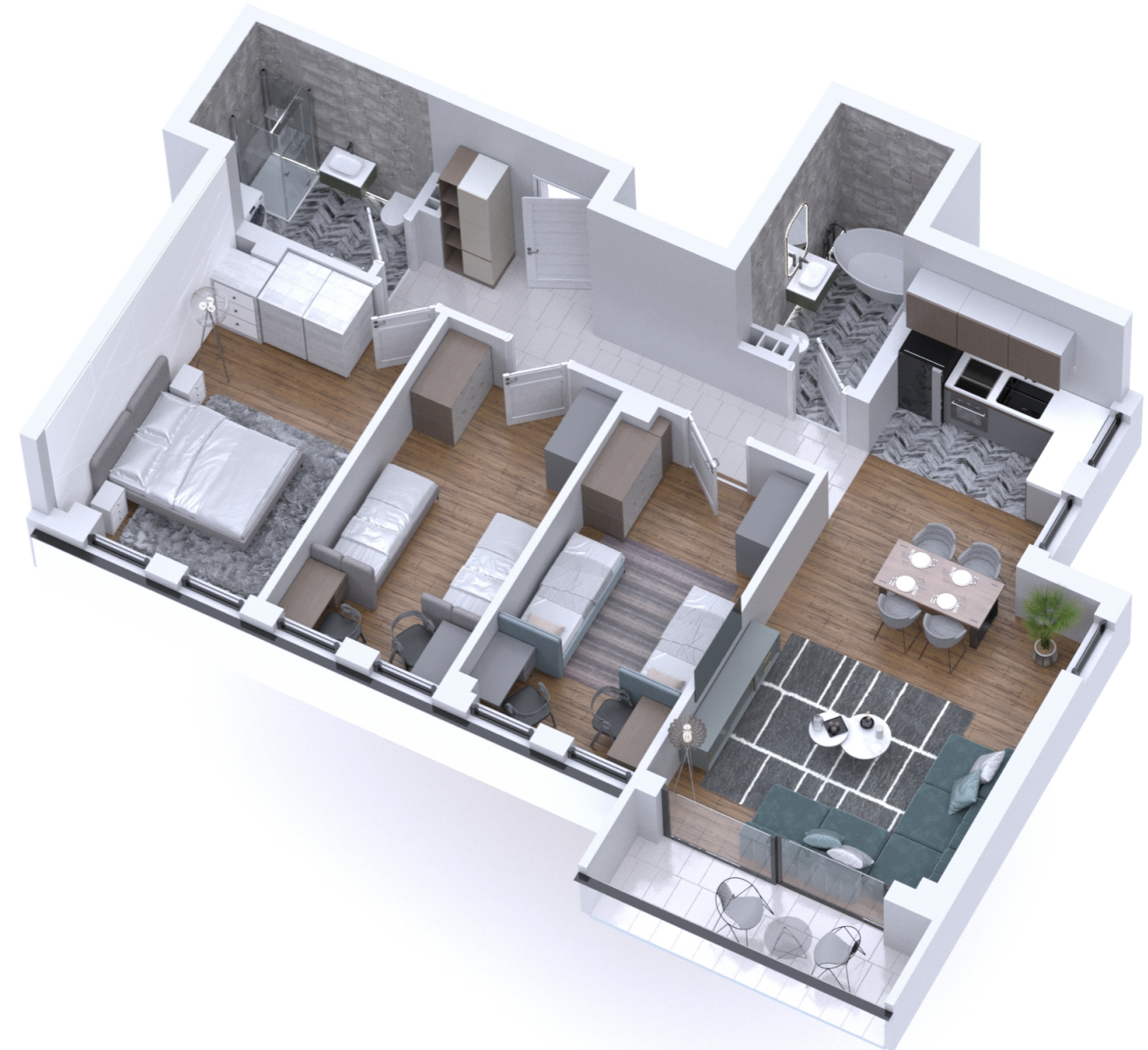
POLOŽAJ U OBJEKTU: