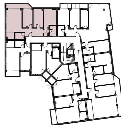
POLOŽAJ U OBJEKTU: